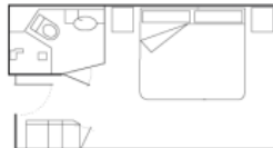
CABINE MATRIMONIALE 16,5 m 2